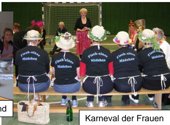
Karneval der Frauen