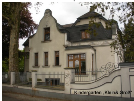
Kindergarten „Klein & Groß“